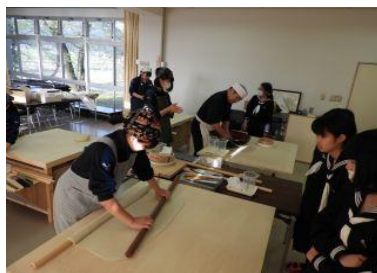
4 / 18 地域協働部 (そば打ち)