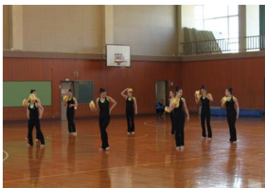
4 / 9 部紹介 (新体操部)