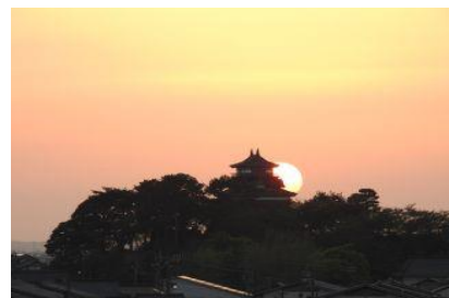
4 / 22 丸岡城に沈む夕日 (丸高より)