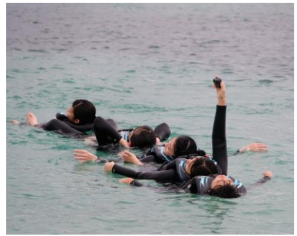
< 2日目 クラス別研修 >