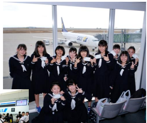
< 4日目 那覇空港 >