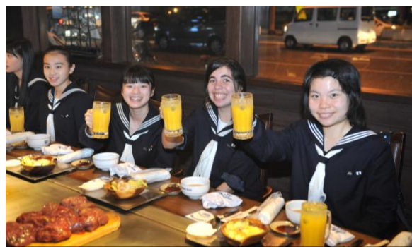
< 1日目 パフォーマンスキッチンで舌鼓 >