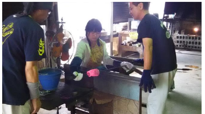
< 3日目 コース別研修 >