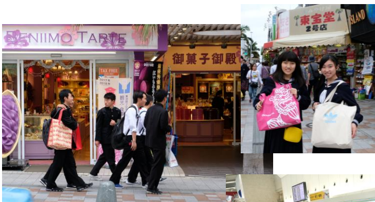
< 4日目 国際通り散策 >