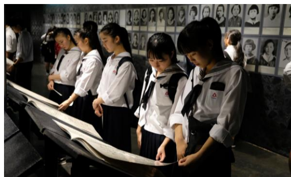
< 2日目 ひめゆり平和祈念資料館での平和学習 >