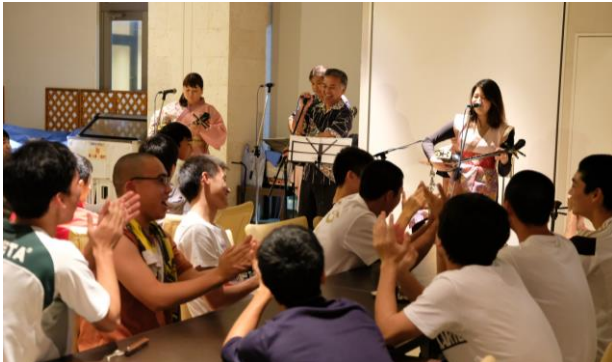
< 2日目夜 郷土芸能を堪能 >