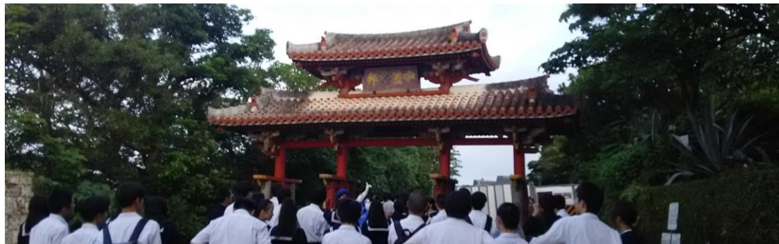
< 1日目 首里城見学（守礼の門） >