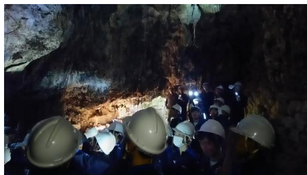
< 2日目 沖縄地上戦の際、一般市民が隠れていた壕(ガマ)での平和学習 >