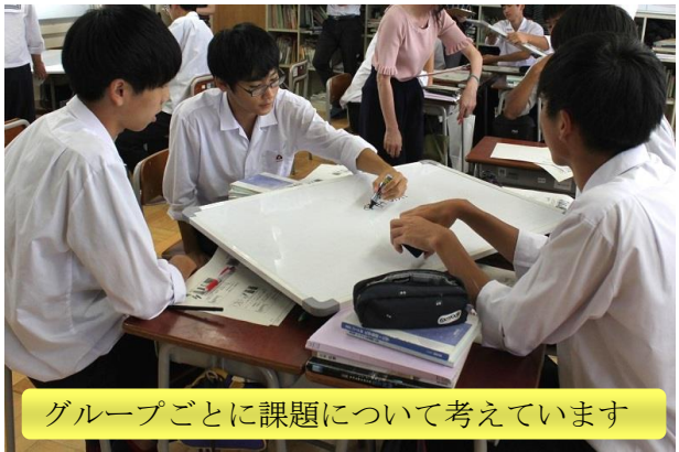
グループごとに課題について考えています