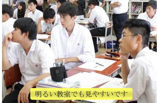
明るい教室でも見やすいです