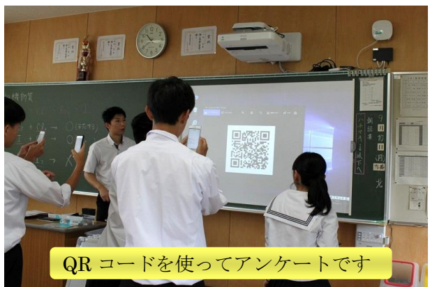
QRコードを使ってアンケートです