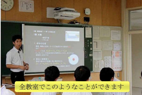
全教室でこのようなことができます