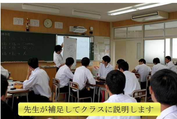
先生が補足してクラスに説明します