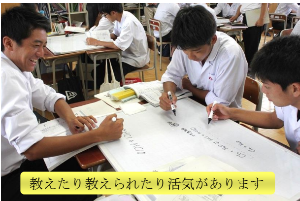
教えたり教えられたり活気があります