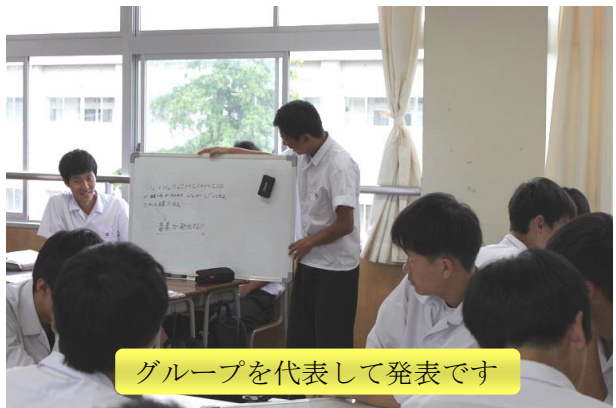
グループを代表して発表です